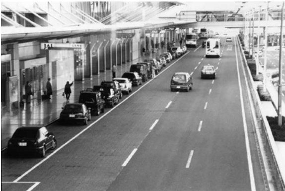
airport terminal/ so

In this part, you can move to the next question by clicking on Next . If you want to return to a previous question, click on Back . You will have 8 minutes to complete this part of the test.